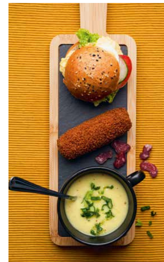
▲ Een twaalf-uurtje biedt alles in één.

De specifieke mogelijkheden en arrangementen zijn te vinden op onze website.